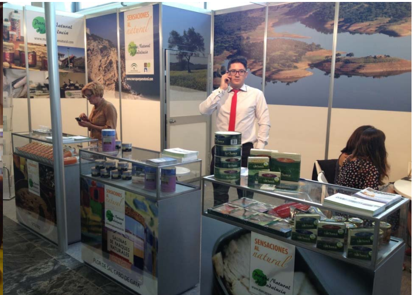
Andalucía Sabor 2013