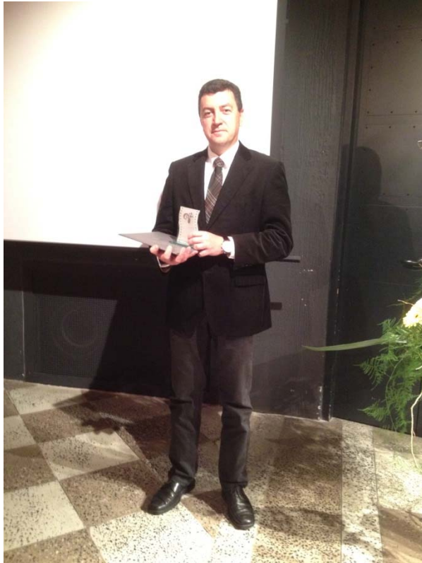
2º premio por el vídeo “Turismo Ornitológico en Parques Naturales de Andalucía” en el 6º Festival TourFilm Riga 2013