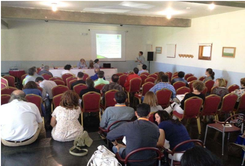
1º Congreso de empresarios de turismo Reserva de la Biosfera y Espacios Naturales Protegidos