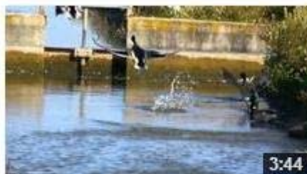
Marca Parque Natural Turismo Ornitológico - español