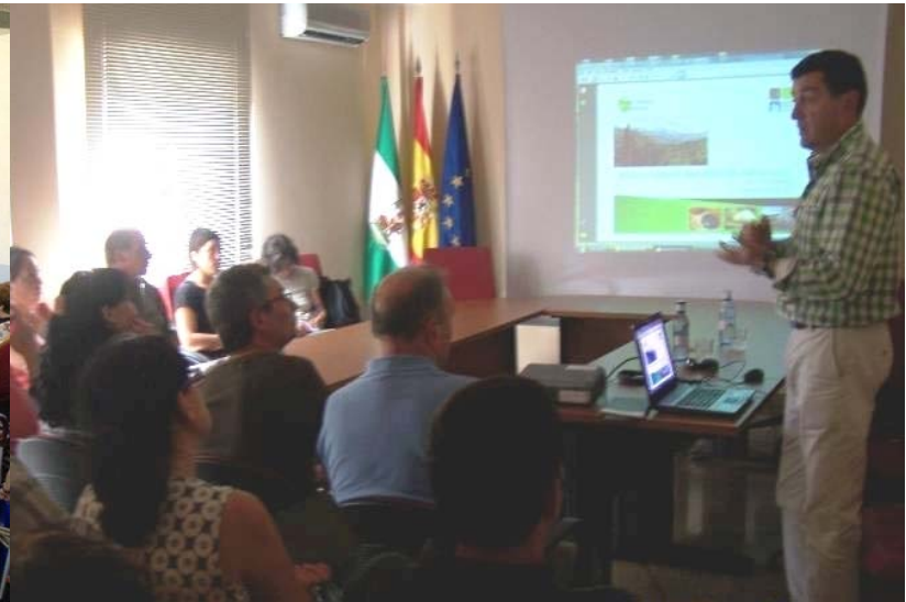
Charla informativa marca Parque Natural Andalucía