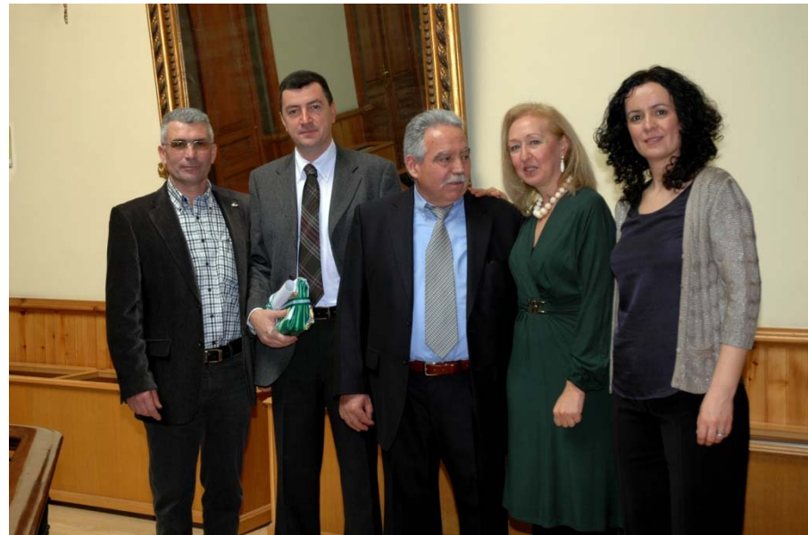
Bandera de Andalucía