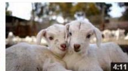
PRODUCTOS ALIMENTARIOS MARCA PARQUE NATURAL.