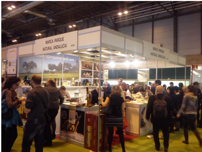
Salón del Gourmet 2014