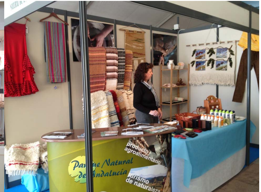
Mercado de productos Naturales Nerja 2012