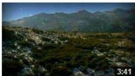
MARCA PARQUE NATURAL ARTESANIA ESP