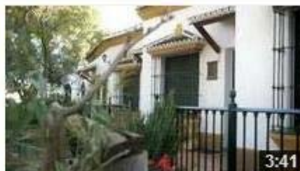
MARCA PARQUE NATURAL DE ANDALUCÍA